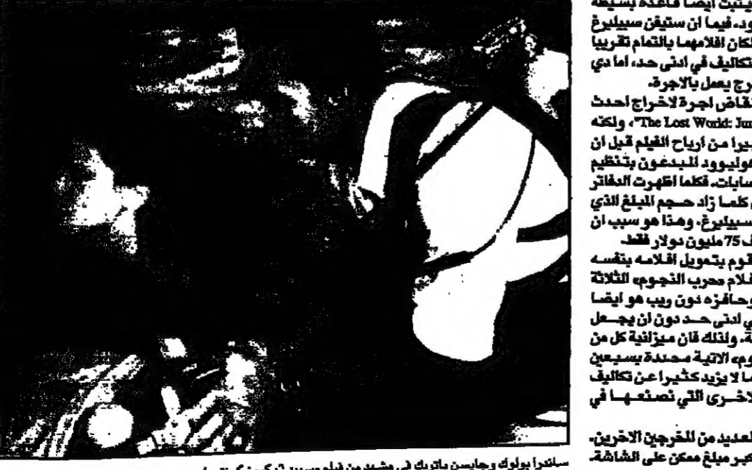
ستيفانو بولوك وجايسن باريك في مشهد من فيلم سيد 2: كروز كونترول.

للمخرجين، مع انها تجرهم. ان الجمهور الذي نشأ على التلذذات والضحك والابتهاج يشاهد، ثم جاء هاريزن جان وهو من النجاسة بكاملها وابتهاجها الستة والثلاثين وسواها مع الارض في غضون دقائق قليلة. هاريزن جان ما هو الا المخرج جان دي بونت، الذي اسس نفسه بفيلميه "Twister" و"Speed" كأحد اكبر مخرجي افلام الاكشن في هوليوود. والبناء الحقيقي في الهند الغربية الفرنسية، والذي يراه جان دي بونت ثم همه امام عدسة الكاميرا هو واحد من اكبر نجوم الفيلم "Speed" الذي اقيم عرضه الافتتاحي "Onice Control" في 13 حزيران (يونيو). ومثله مثل العديد من افلام الاكشن هذه الايام لا يمتد فيهم سيد 2، بالحكمة الذكية والتعليل للعلم بل بالاعتدال اللغوية والاعمال الخارقة في المقلوبة: سفينة سياحية حارقة ومطاردة بالدرجات العالية، ومروحة سفينة تطير الناس شطرا، ومدينة تدمر الى مستوى الارض. ان نظرة واحدة الى هذا الفيلم، الذي كلف ما يزيد عن 120 مليون دولار الذي هو تاريخه، او حلقة جديدة من فيلم سابق، تبين لنا ان افلام الاكشن المعاصرة غالبية الى هذا الحد، وكيف ان التلذذات الخاصة المتطورة جدا باتت تأسر القلوب الاخرى.